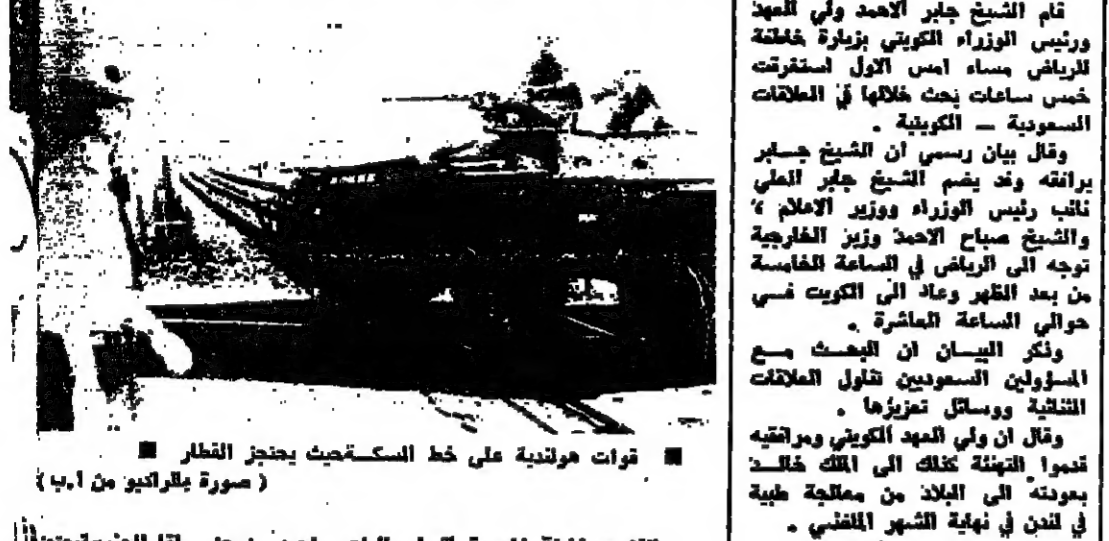
قوات هولندية على خط السكك الحديدية يحتجز الفطار ( صورة بالترتيب من اليمين )